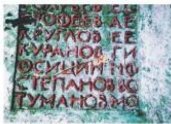
Деревня Доможирка у церкви Святой Троицы. Памятник борцам, погибшим в гражданскую войну в 1919г.

23 января 1919 года (сто лет назад) в село Скамья для проверки дел прибыли большеви-