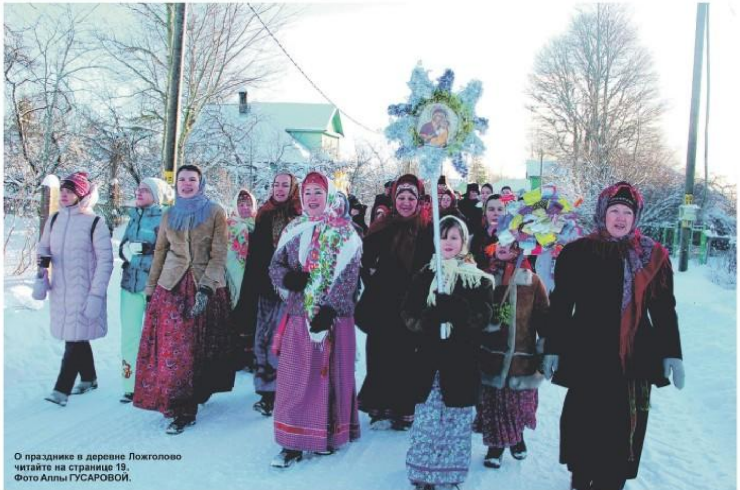
О празднике в деревне Ложголово читайте на странице 19.

Газета ИЗДАЁТСЯ с февраля 1944 года Пятница, 18 января 2019 года № 2 (14915)