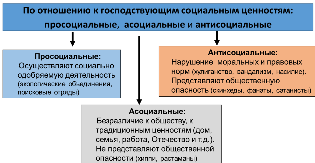
Рисунок 4.1. Классификация молодежных субкультур

НМО следует отличать от радикальных политических и религиозных формирований , обладающих наряду с субкультурой четкой структурой и фиксированным членством.