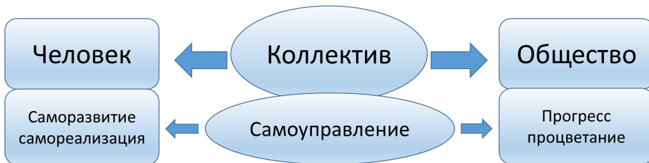
Рисунок 1.1. Взаимосвязь развития человека и общества

А самоуправление – это способ организации и управления этой жизнедеятельностью, где есть свобода выбора и самоопределение, согласование личных и общих целей и ценностей, где переплетаются игра, познание и труд (основные виды деятельности человека), где общение является содержательным и интересным, а не бездеятельным и пустым, где одновременно развивается и коллектив, и каждая личность.